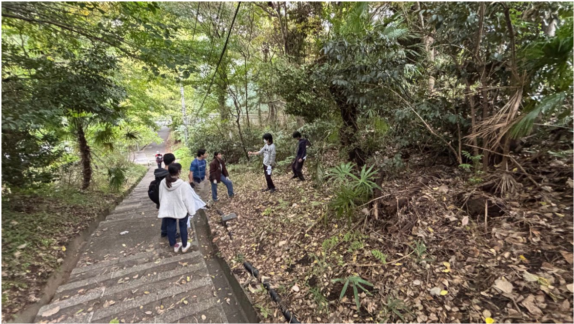
図2 日吉キャンパスを舞台にした中高大連携「日吉の森実習」の様子。